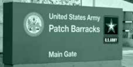
Stuttgart – gar nicht so lieblich: In Möhringen liegt die Einsatzplanung von Atomwaffen in den Schubladen!