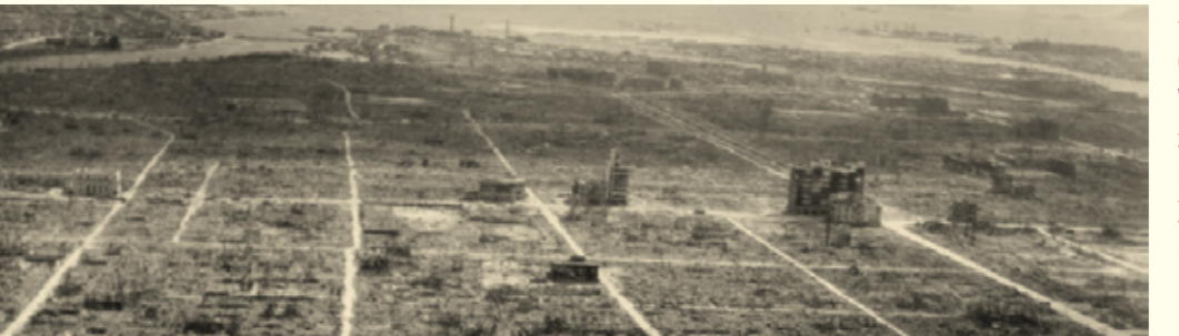
Hiroshima, 6.8. 1945. Heutige A-Waffen können handlich klein oder auch 100-fach stärker sein.

Auf der Strecke bleiben das humanitäre Völkerrecht und das Recht der Menschen auf Frieden – ganz abgesehen von den hierfür geplanten immensen finanziellen Aufwendungen, die dringend z.B. im sozialen Bereich gebraucht werden.