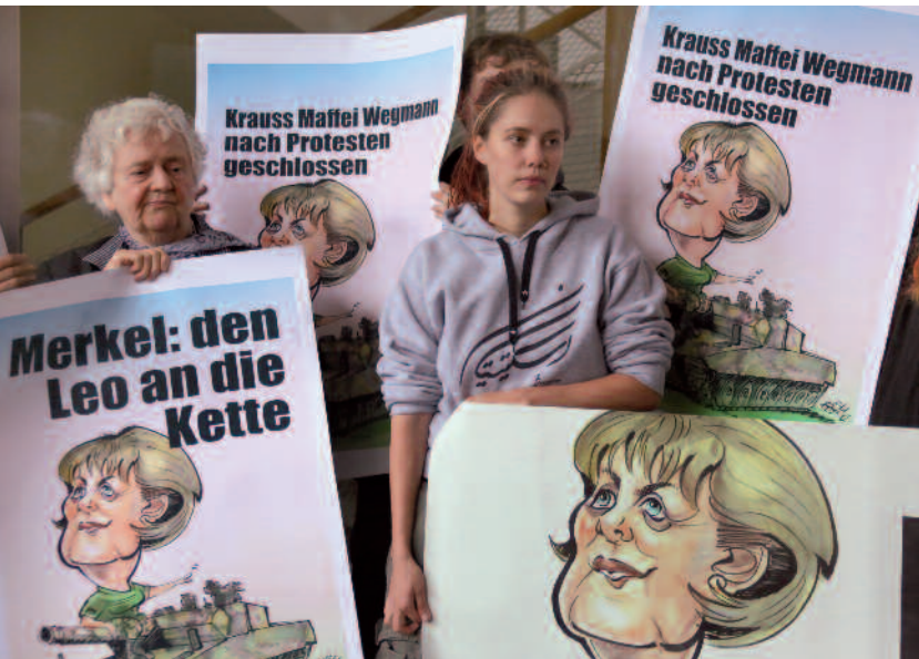
Demonstration vor der Zentrale von Krauss-Maffei Wegmann in Berlin

Eines der Hauptanliegen der »Aktion Aufschrei – Stoppt den Waffenhandel!« ist es, den Tätern Name und Gesicht zu geben. Täter – das sind zum einen die Mitglieder der Bundesregierung und die sie unterstützenden Abgeordneten der Regierungsparteien. Täter – das sind aber auch die Eigentümerfamilien und Großaktionäre der Rüstungsfirmen.